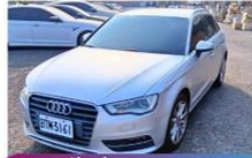
汽車 AUDI 2013.7/1,798cc