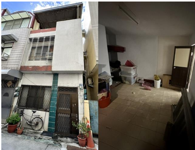
高雄執行分署三拍河北一路靜巷透天之外觀與屋內現況，底價 606.3 萬元