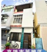
高雄市苓雅區 正明段