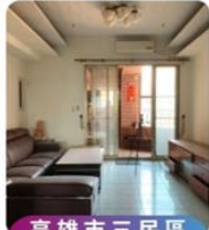
高雄市三民區 三塊厝段