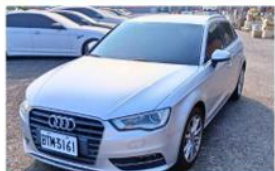
汽車 AUDI 2013.7/1,798cc