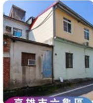
高雄市六龜區 新民庄段