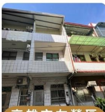
高雄市左營區 左西段