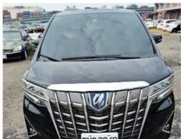
汽車 TOYOTA 2020.8/2,494cc