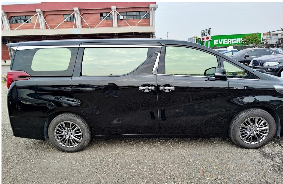
高雄執行分署 2 月 3 日法拍 2020 年式 TOYOTA ALPHARD 油電混合 7 人座自用小客車