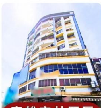
高雄市林園區 林園段