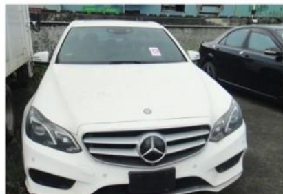
汽車 BENZ 2014.6/3,498cc