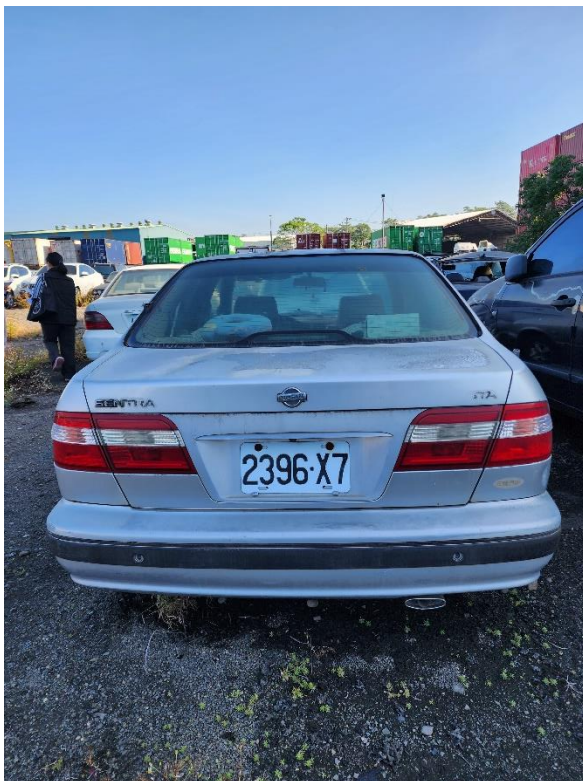
圖片一 屏東地檢署囑託變價物件-車輛

本次臺灣屏東地方檢察署囑託高雄分署拍賣物件，皆置放於法務部南區大型贓物庫（高雄市前鎮區草衙二路 50 號），於拍賣當日下午 1 時至 2 時整開放民眾至現場觀覽。有意願參與競標民眾，請於拍賣當日下午 2 時 30 分至 2 時 59 分持身分證明文件至高雄分署（高雄市苓雅區政南街 2 號）一樓設立之應買人登記處完成登記，下午 3 時起將依現場公布之動產拍賣一覽表順序進行公開拍賣。民眾如欲進一步瞭解相關拍賣訊息，可至高雄分署臉書或官網的「應買人專區」參閱拍賣公告。