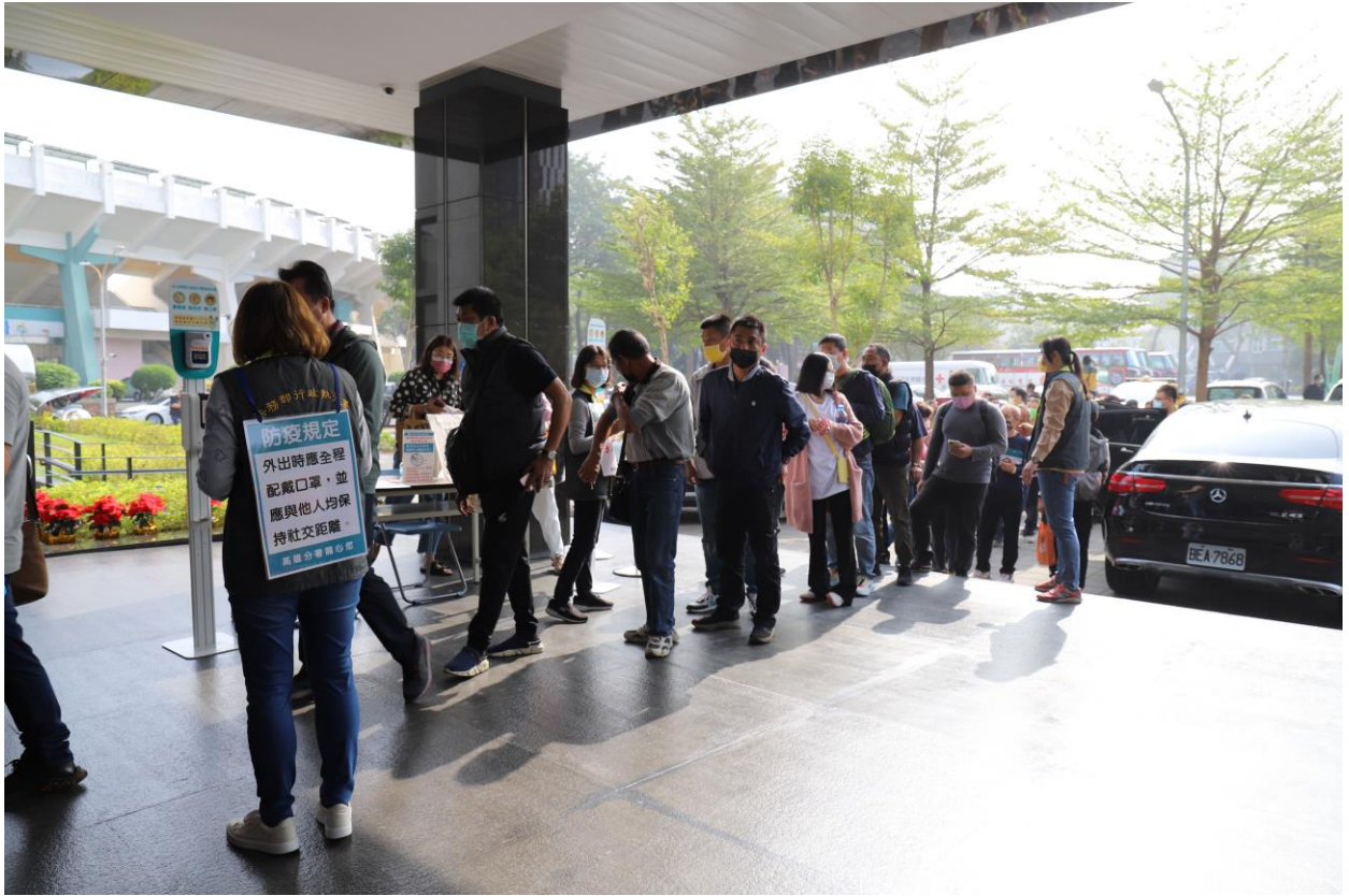
民眾排隊依序辦理應買登記