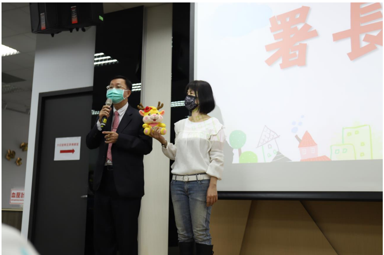
法務部行政執行署林署長慶宗宣導拍賣刑事扣押物的法律觀念