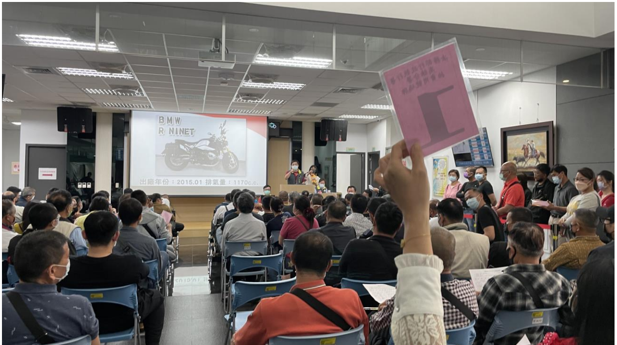
重型機車拍賣現場