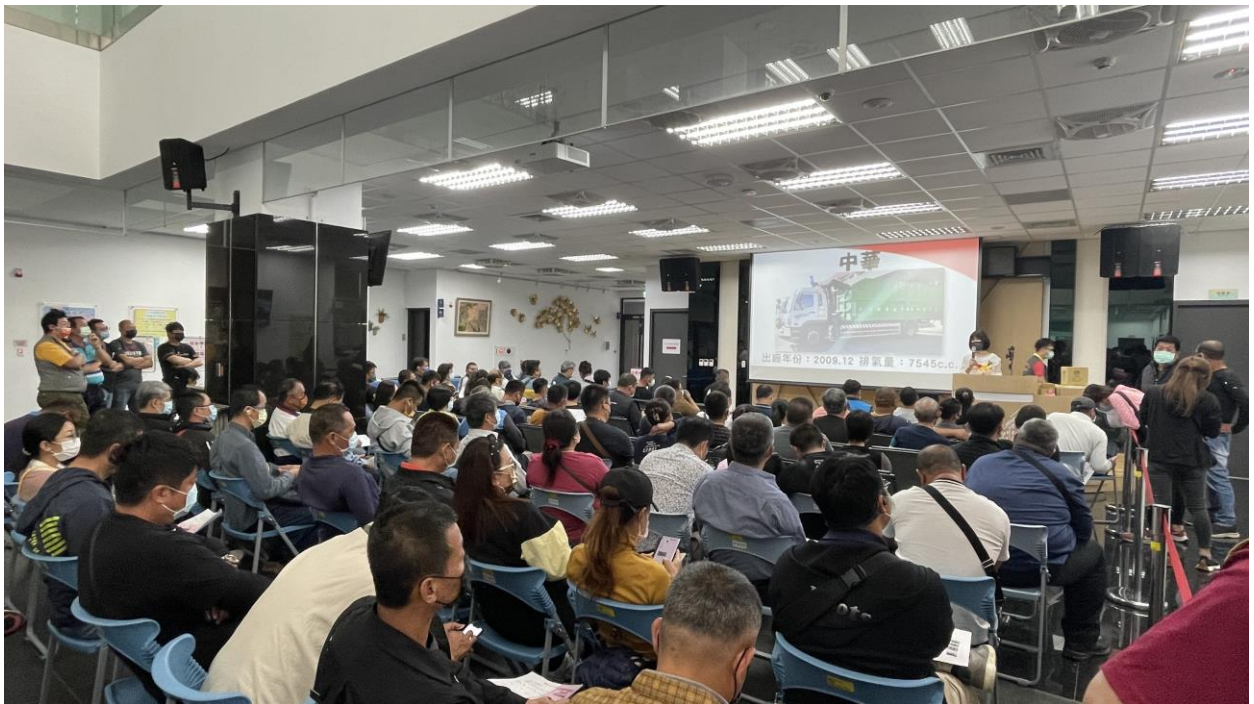
環保清運車拍賣現場