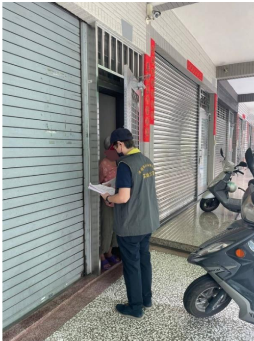
圖片 執行人員至滯欠百萬防疫罰鍰莊男住家現場執行

本日專案執行案件之 22 位義務人中，有部分義務人未在住居所現場，高雄分署已將現場執行通知交予在場家屬，無人在場者則已將通知投入信箱中，義務人應依通知單所載到場時間至高雄分署辦理繳納手續，如義務人置之不理，逾期未到，高雄分署審酌個案情形，不排除以拘提方式將惡意不繳之義務人拘提到案。